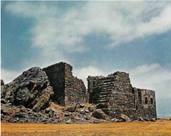
Fabrica di Oro na Bushiribana